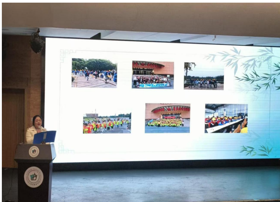
图 3 企业导师为学生授课

订单班实施“校企双导师制”，企业导师与学院教师共同指导学生完成真实项目。如 2025 级订单班学生参与设计的“竹文化一日研学”路线，已入选四川省中小学研学推荐目录。