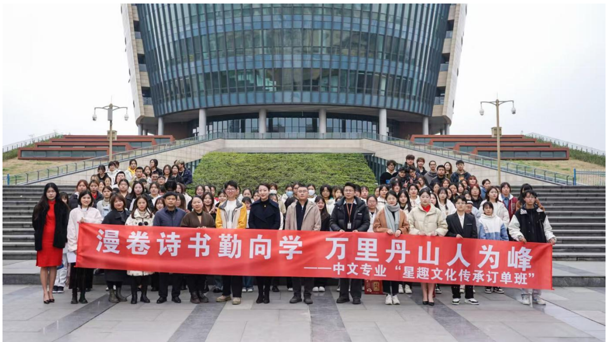
图 1 中文专业“星趣文化传承订单班”开班仪式