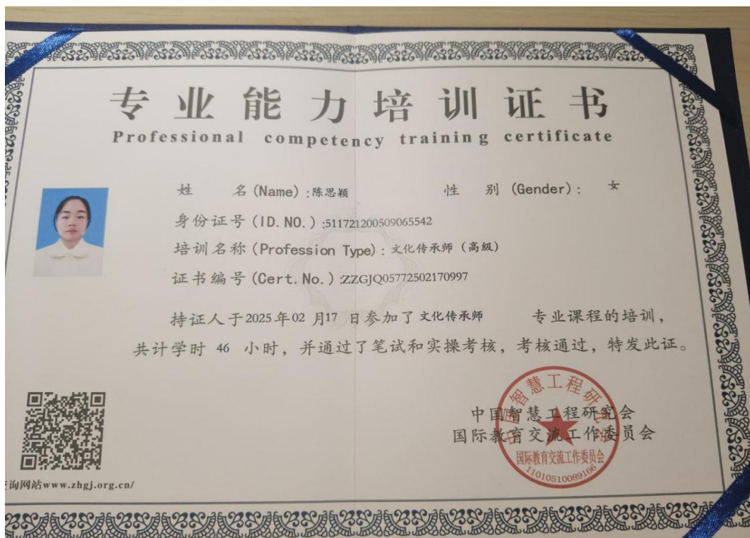
图 5 学生考取文化传承师证书