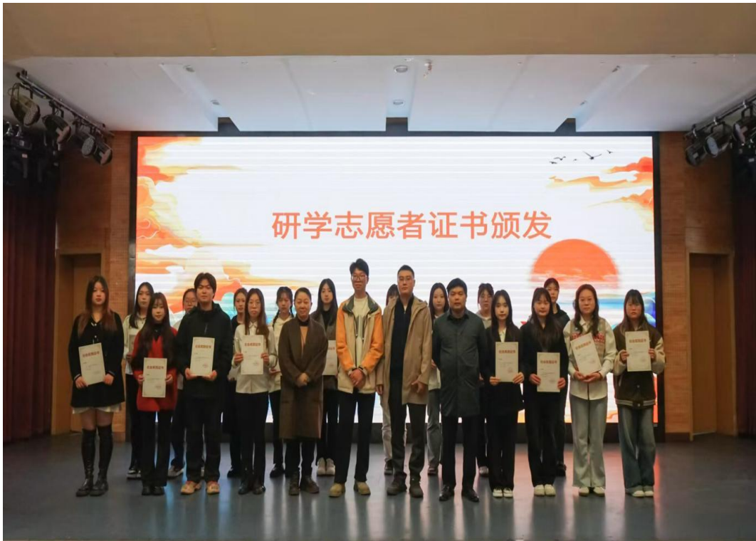
图 4 研学志愿者证书颁发仪式

通过演讲比赛、面试选拔等多元评价，强化学生综合素养。2025年共培养优秀研学导师 17 人，其中 7 人获企业颁发的社会实践证书。