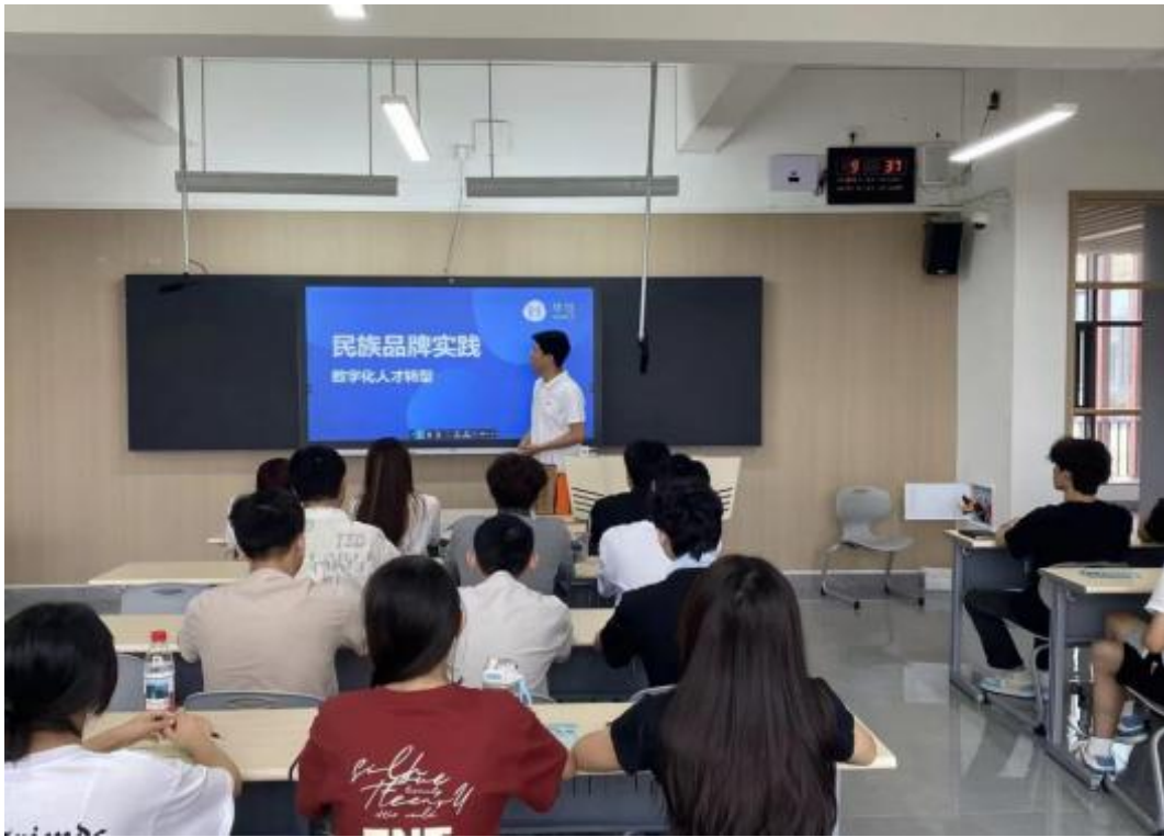
图4 企业为教师到校授课