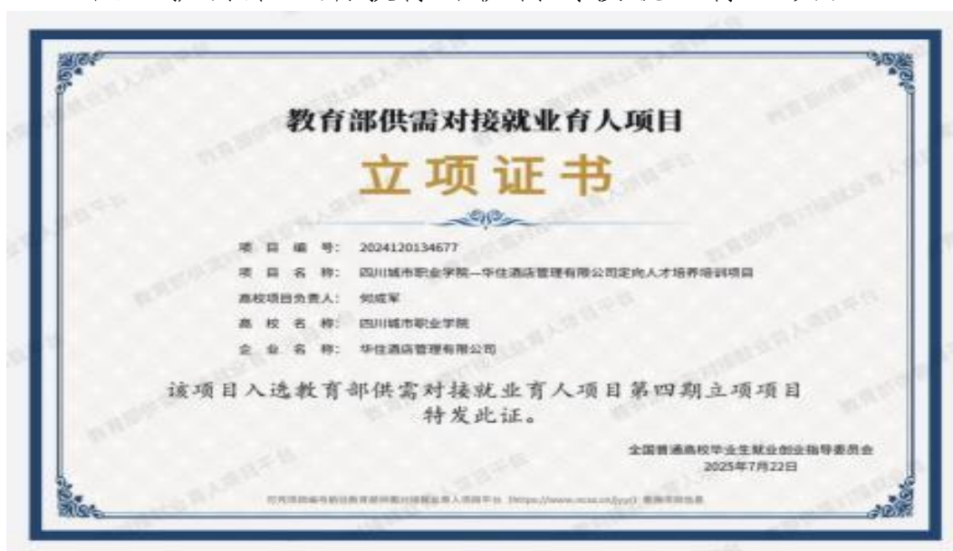
图9 获得第四期教育部供需对接就业育人项目