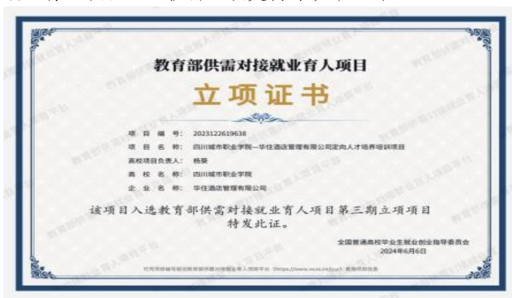
图8 获得第三期教育部供需对接就业育人项目

专业教师中“双师型”比例提升至 100%，5 名教师获华住系统培训。合作项目连续 4 年（2022-2025）入选教育部“供需对接就业育人项目”，获得立项支持与政策认可。