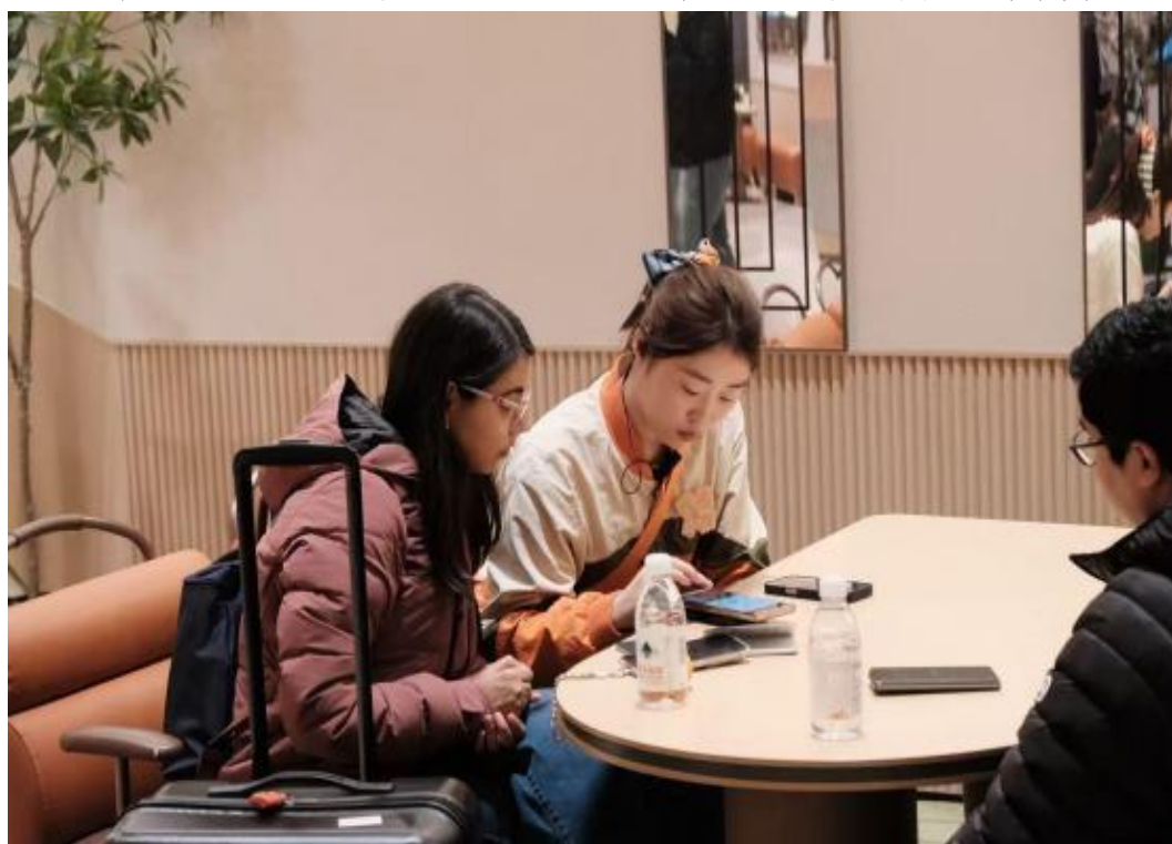
图7 2023 级订单班学生在门店实习

就业对口率高，2025 届订单班毕业生就业率达 95%以上，对口就业率超过 95%，多数学生入职即胜任高级前台等岗位。