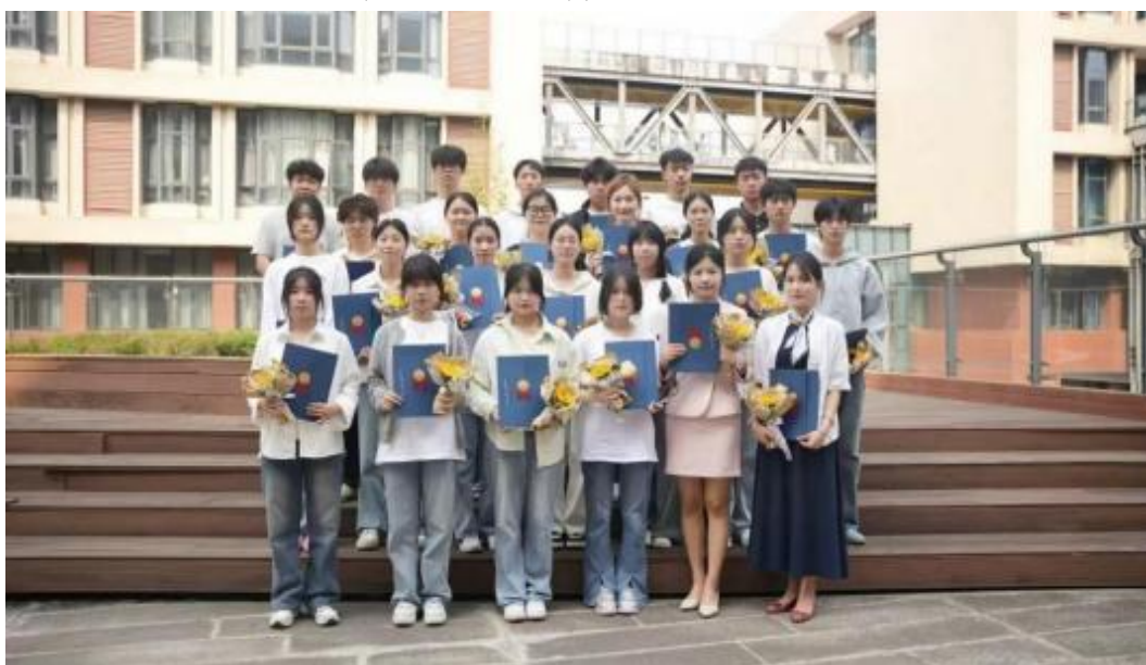
图1 2024 级订单班开班仪式

合作模式具有以下特点：第一，全程贯通的培养路径，从大一起组建订单班，实施“企业认知—课程嵌入—实训强化—岗位实习—就业跟踪”五段式培养。第二，动态调整的规模机制，每年根据企业区域人才需求与学校招生情况，合理确定订单班数量与人数，2025年新开班1个，录取24人。第三，双班主任协同管理，学校专业导师与企业派驻班主任共同负责班级管理、学业指导与职业规划，确保培养过程不断线。