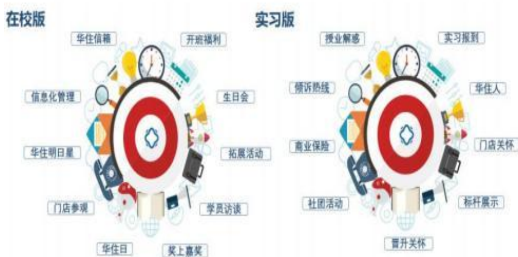
图2 华住订单班关怀计划

课时，全部费用由企业承担。二是学习环境企业化，为订单班定制专属班服、学习材料，营造沉浸式企业氛围。三是关怀体系人性化，实施“华住订单班关怀计划”，涵盖心理健康讲座、职业素养工作坊、团队拓展、生日关怀等活动，强化学生的组织归属感与职业认同。