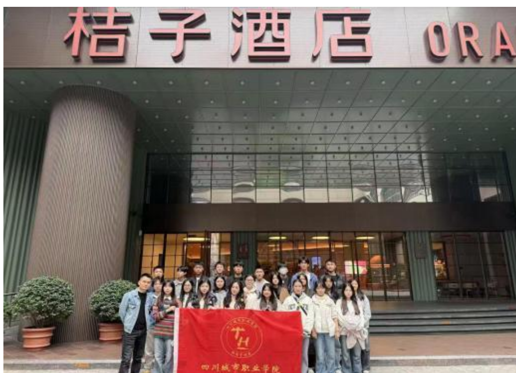
图5 2024 级订单班学生到门店参访

参与学期专周实训，每学期组织学生赴华住旗下品牌门店开展认知实习、岗位体验与技能实训，企业负责交通、讲解、现场指导与安全管理。推动建设教师实践流动站，合作建立“教师企业实践基地”，每年接纳 3-4 名专业教师进行为期不少于一个月的跟岗锻炼，参与门店运营、培训与管理，反哺教学与课程开发。