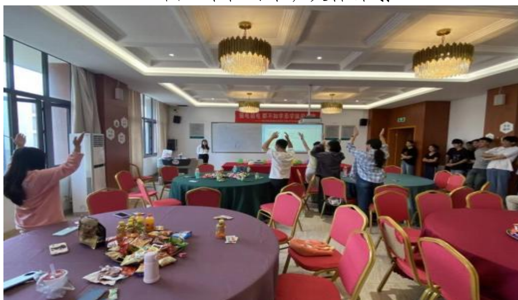
图3 企业为 2024 级华住订单班开展生日关怀